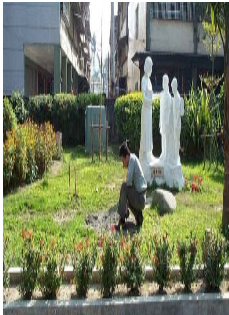
本測站位於後紅國小側門旁之花圃內,離圍牆約2m處,鄰近有民房,學校校史館及一小排水溝,如示意圖所示,裝設地點並非為擋土牆結構,亦不與鄰近結構物相連。